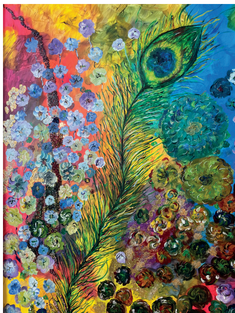
PLUME DE PION Huile sur toile 80x60 cm