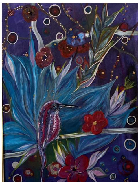
L'OISEAU Huile sur toile 50x40 cm